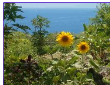
Uitzicht op de baai

Deze reis gaat over de liefde. De liefde voor de dolfijnen die mensen voelen is een voorbeeldliefde. Iedereen wil liefhebben zoals de dolfijnen elkaar en ons liefhebben; met zo veel digniteit maar zo diep en absoluut onvoorwaardelijk. Het betekent dat er geen agenda's zijn en alleen een totale connectie in het hier en nu. Met volledige overgave aan het groter geheel en met een open hart kan je je volledig gelukkig voelen.